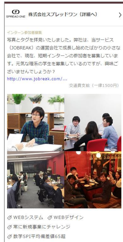
【メッセージ画面イメージ】

※ Amazon.co.jp は、本プログラムのスポンサーではありません。 Amazon、Amazon.co.jp およびそのロゴは Amazon.com, Inc. またはその関連会社の商標です。